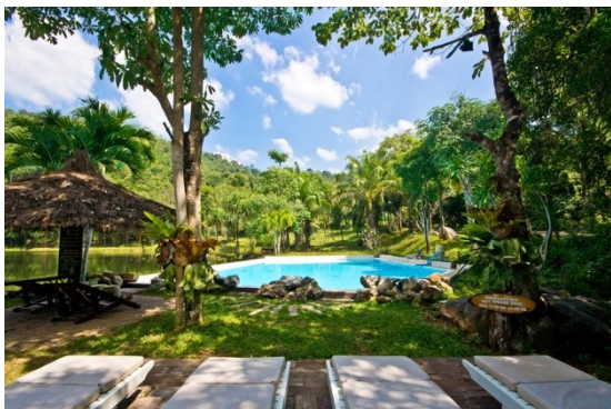
Home Phutoey Kanchanaburi