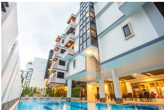
New Siam Palace Bangkok