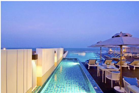
The Rock Hua Hin