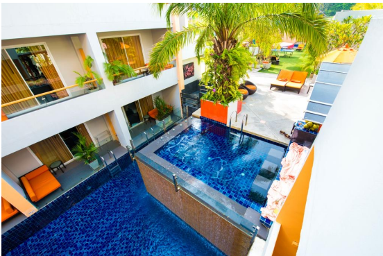
FuramaXclusive Cham Am